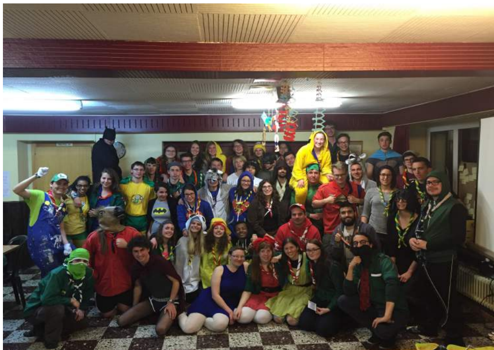
HIGHLIGHT: COURS BASE / RU